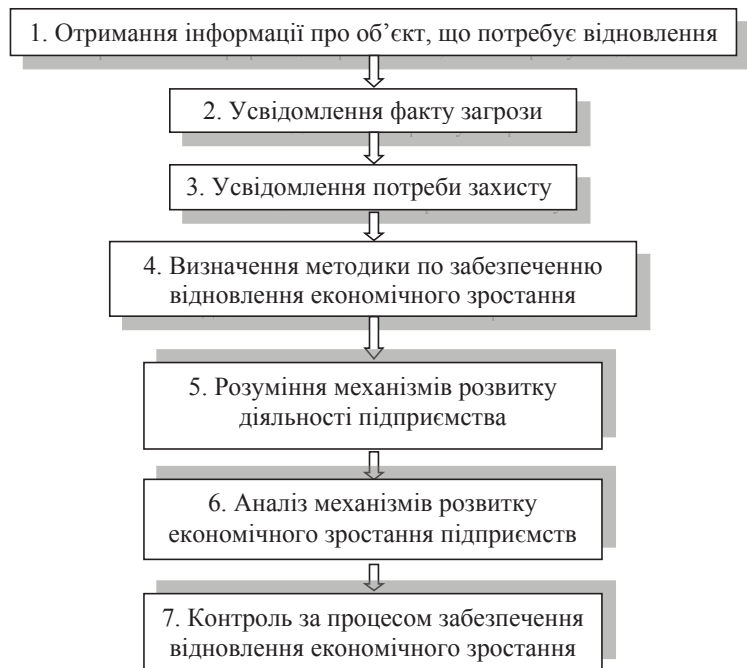
Рис. 2. Пропозиція алгоритму відновлення економічного зростання ПАТ «ТОДЕФ»

Висновки. Головними проблеми виділені у дослідженні відновлення економічного зростання суб'єктів господарювання, які існують в умовах фінансово-економічної кризи сьогодення є: відсутність усвідомлення потреби відновлення економічного розвитку підприємства; недостатньо обізнаний персонал у питаннях економічного розвитку; відсутність розуміння механізмів економічного розвитку; немає чіткої системи управлінням від-